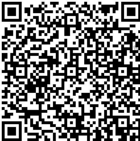
QR de la entrega